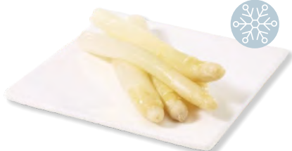
Spargeln weiss Asperges blanches frigemo 5 x 1 kg | Art.Nr. 203868