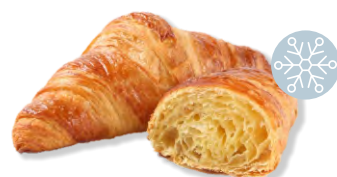
Buttergipfel Croissant beurre Delifrance 80 x 55 g | Art.Nr. 206636