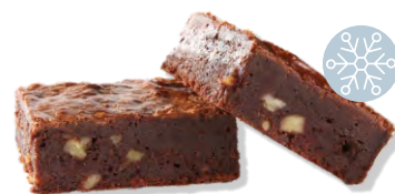
Brownie Delifrance 120 x 80 g Art.Nr. 206866