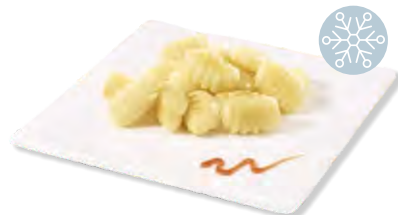
Gnocchi frigemo 2 x 2 kg Art.Nr. 201535