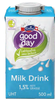
Milchgetränk UHT UHT Lait sans lactose Emmi 1.5% | Art.Nr. 60395