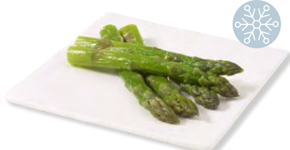
Spargeln grün Asperges vertes frigemo 5 x 1 kg | Art.Nr. 203450