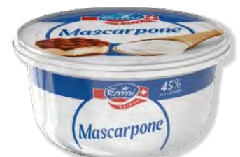
Mascarpone Emmi 500g | Art.Nr. 61413