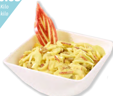
Fenchelsalat Curry Salade fenouil au curry frigemo 5 kg | Art.Nr. 35081