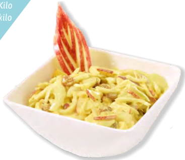
Fenchelsalat Curry Salade fenouil au curry frigemo 1 kg | Art.Nr. 35080