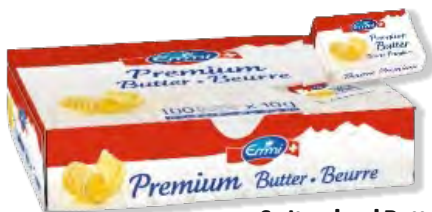
Switzerland Butter Beurre en cubes Emmi 82% 100 x 10 g | Art.Nr. 60764