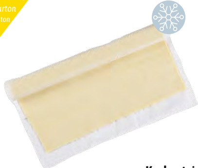
Kuchenteig K&S 7 x 900 g 40 x 58 cm Art.Nr. 207590