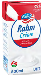
Suisse Vollrahm UHT UHT Crème entière Emmi 12 x 500 ml | Art.Nr. 60417