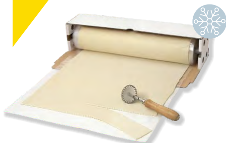
Blätterteig Rolle Pâte feuilletée K&S 40 x 270 cm 3kg | Art.Nr. 200650