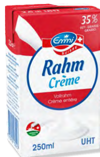
Suisse Vollrahm UHT UHT Crème entière Emmi 18 x 250 ml | Art.Nr. 60415