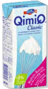
UHT QimiQ Basis Emmi 12 x 1 L | Art.Nr. 61318