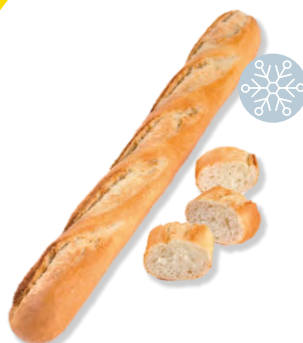
Baguette Delifrance 58 cm | 32 x 290 g Art.Nr. 205775