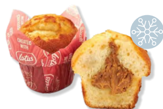
Lotus-Biscoff Muffin Delifrance 24 x 110 g Art.Nr. 207567