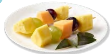
Fruchtspiess Brochette fruits Frigemo 20 x ca.70g | Art.Nr. 36816