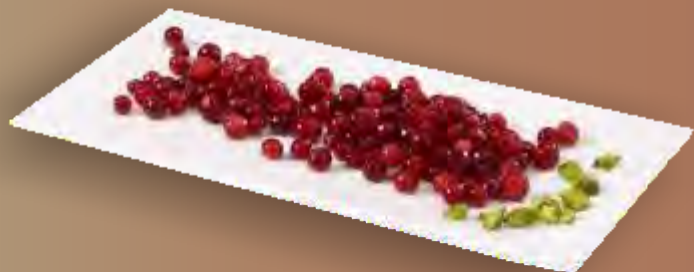
Frigemo*Preiselbeeren 5kg TK N°210429