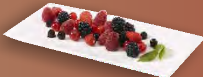
Frigemo Waldbeerenmischung 5kg TK N°210493