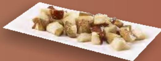
Steinpilze geschnitten (Würfel) 5x1kg TK N°213267