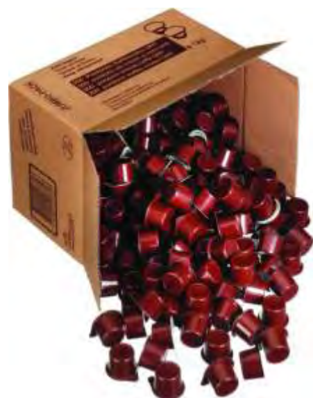
KR Portionen 200x12g N°530022