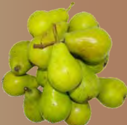
Birne für Wild N°41780