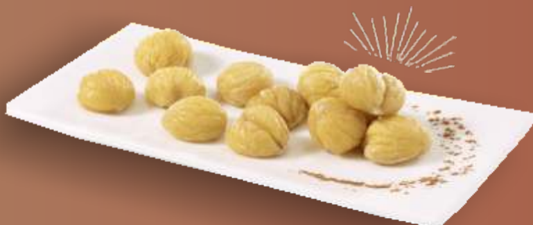
Frigemo Marroni ganz geschält TK 5kg N°210205