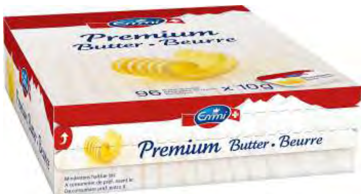
EM Premium Butter Becher 96x10g N°701028