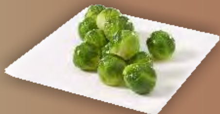
Frigemo Rosenkohl normal 2x2.5kg TK N°210099