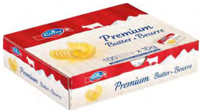
EM Butter Würfel 100x10g N°701025