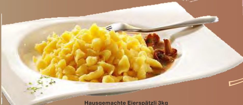
Hausgemachte Eierspätzli 3kg N°180205

Planen Sie Ihre Menüs für die Wildwoche und begeistern Sie Ihre Gäste mit „wilden“ Kreationen und ausgefallenen Kombinationen.