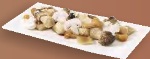
Frigemo Mischpilze Standard 5x1kg TK N°214312