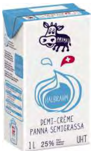
Profi(t) Halbrahm UHT 25% 1l N°526013

Anrufen und von Top-Konditionen profitieren! Für weitere Auskünfte steht Ihnen unser Verkaufsteam gerne zur Verfügung. Weitere Angebote finden Sie auf unserer Website.