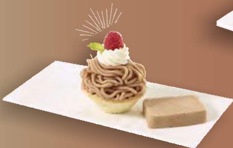
Frigemo Marroni Purée Block 5x1kg TK N°210203 Marroni Purée mit Kirsch 6x1kg TK N°213452